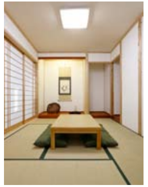
●リビングに隣接させた本格和室。