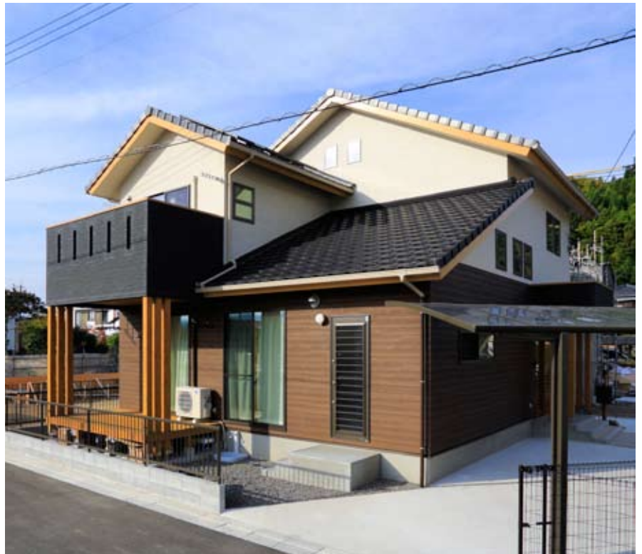
●屋根には陶器の防災瓦、外壁は光触媒のサイディングを採用。落ち着いたカラーリングが存在感と重厚感を演出。