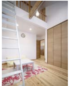
●勾配を利用したロフト付き子ども室。