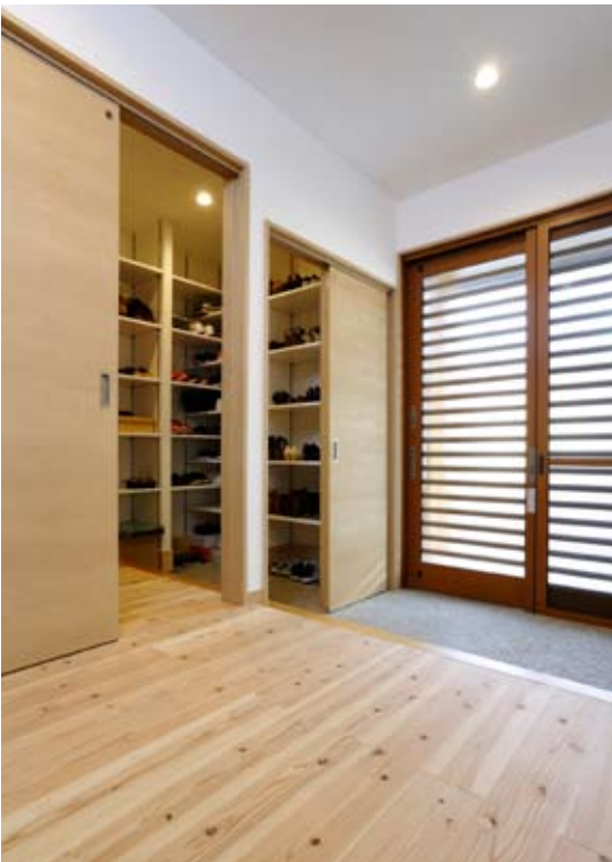
●靴好きの娘さんのコレクションも楽々収納できるシューズクローク。