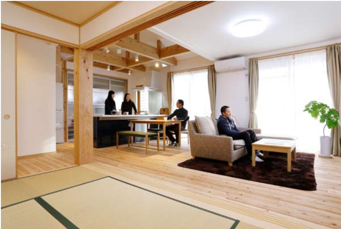
●家族が集まるリビングは風通しと日当たり抜群。和室を開け放てば、縦にも横にも開放的な大空間に。