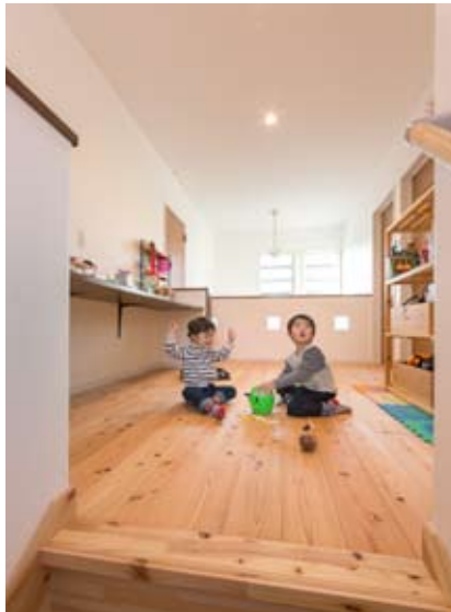
●2階ホールの多目的スペースはお子さんの格好の遊び場に。