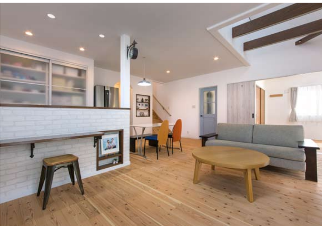
●さらさらとした木目の肌触りが気持ちいい“日田杉浮づくりの床”は天領木の家の特長。その心地よさは、ご主人が天領木の家に惹かれた理由のひとつ。