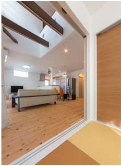
●吹き抜けの開放感溢れる18帖のLDKには和室も隣接。