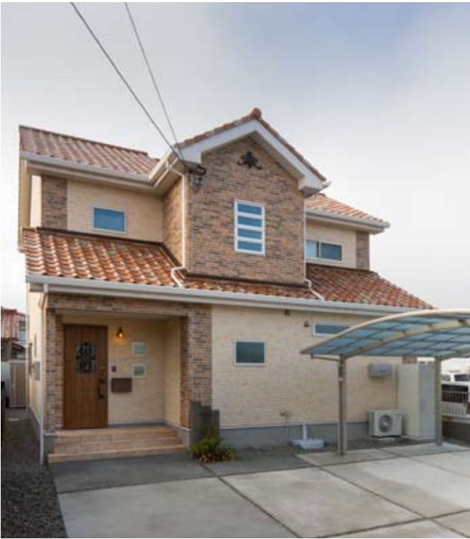
●外壁のサイディング、屋根瓦、玄関ドア、窓サッシにいたるまで南仏風の可愛らしさをイメージした外観スタイル。

「家賃を払い続けるより、子どもがのびのびと育つ家を」という思いからマイホームを決心されたのは2