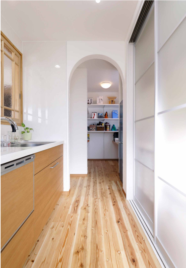
●アールの下がり壁がアクセントになったキッチンから家事コーナーを眺めて。