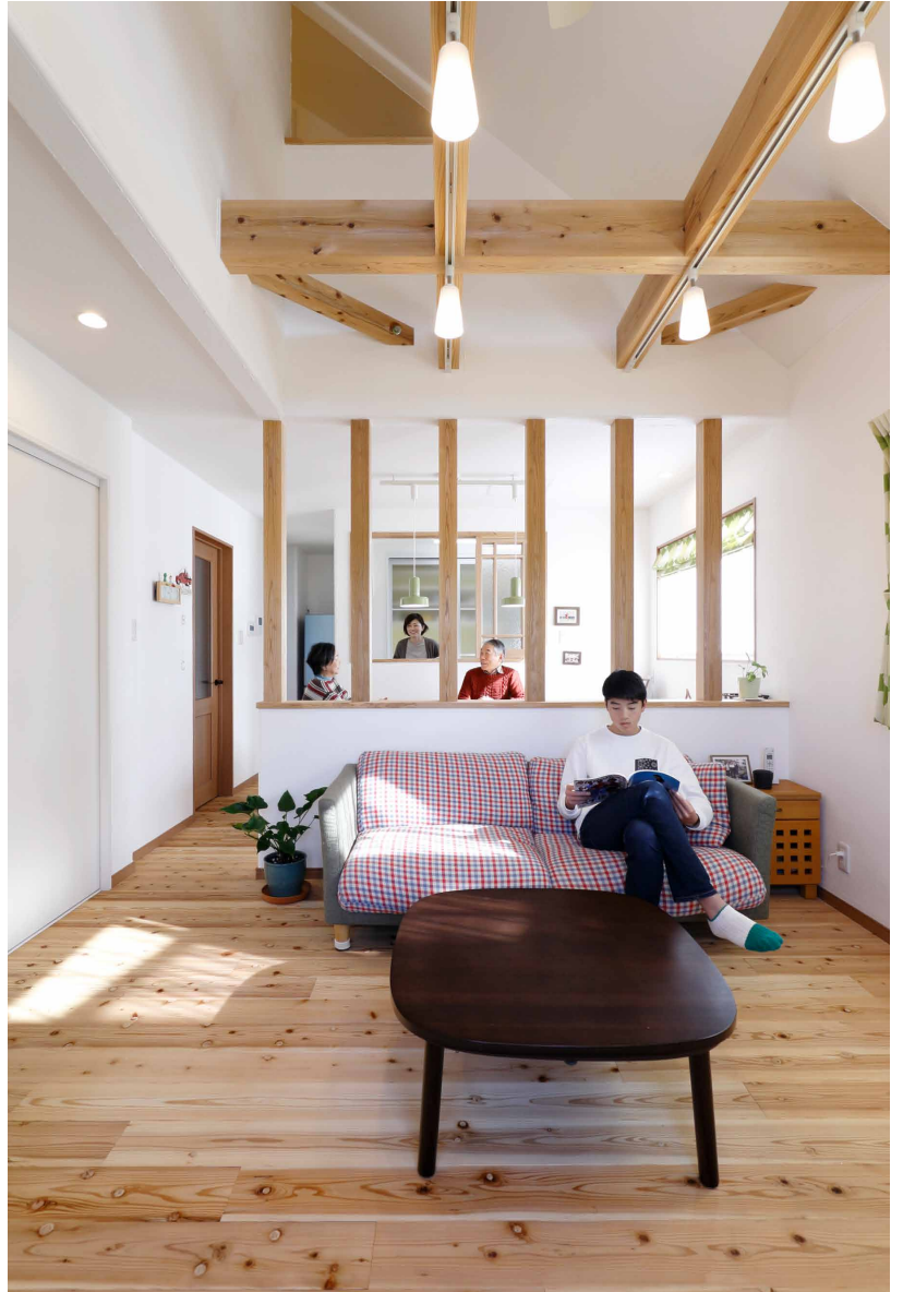
●格子で仕切りながらも内窓が開いたキッチンとダイニングの気配が伝わるリビング。