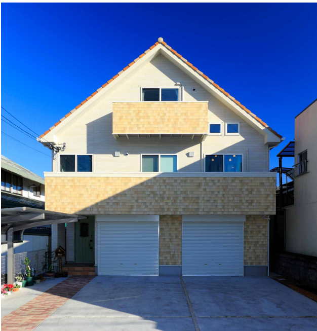
●オレンジの洋瓦と三角屋根が可愛い穴井邸。2階バルコニーはゆるやかな目隠しに。